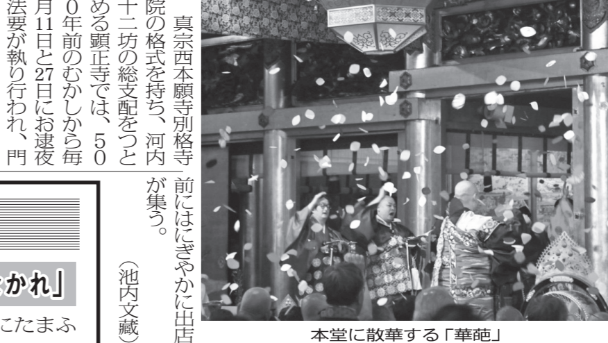
真宗西本願寺別格寺院の格式を持つ、河内が集う。

一年一回のこの日法要では僧侶たちの手によって色とりどりの花型の紙片「華葩」が散華され、その数は8万4千に及ぶ。 室町時代の浄土真宗の僧・蓮如(1415-1499)は、青蓮院の末寺に過ぎなかった本願寺を再興した。蓮如の没後、戦国が世に「一向門徒」と呼ばれた信徒らはこの御坊を中心に二重の濠と塀をめぐらせ、甚麗の目のような寺内町を造り上げた。