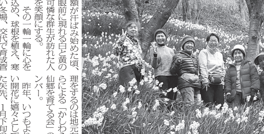
かしわら水仙郷を訪れた人たち

都市部から気軽に行けるハイキングコースとして、多くの人が散策に訪れる柏原市の高尾山創造の森では、春を告げる水仙が見ごろを迎えている。かしわら水仙郷を取材した。