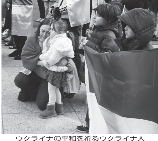
ウクライナの平和を祈るウクライナ人

あたたかくて、ずずしくて、体にやさしい。 体験宿泊ができるモデルハウス、できました!!