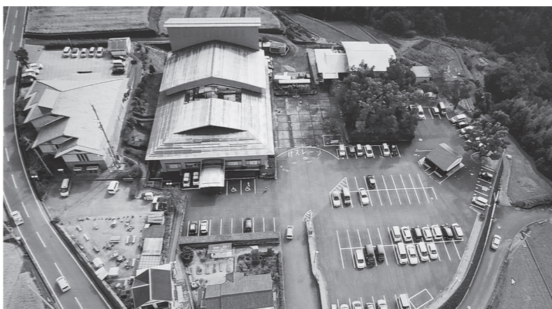
楠木正成千早城の戦いまでの楠木館。今はくすのきホールが建つ。右に正成生誕顕彰碑